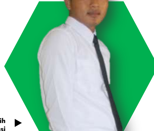
▶ Gunakan kemeja putih lengan panjang dan dasi warna hitam