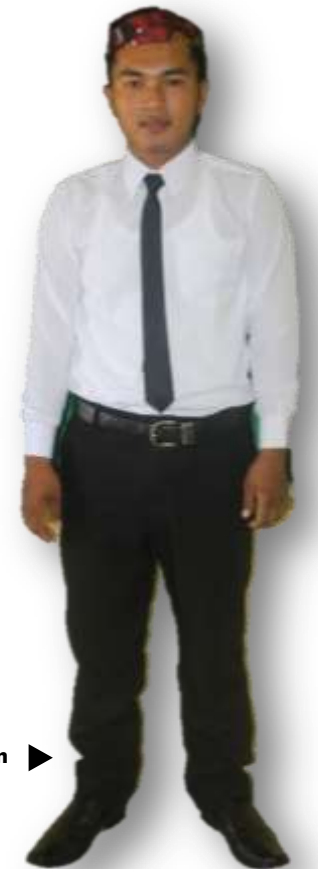
▲ Sepatu pantovel hitam, kaus kaki putih