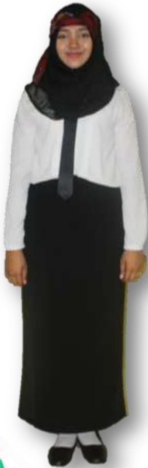
▲ Sepatu pantovel hitam, kaus kaki putih